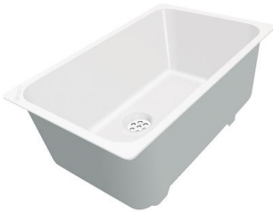
Weiße Wanne 8153 100